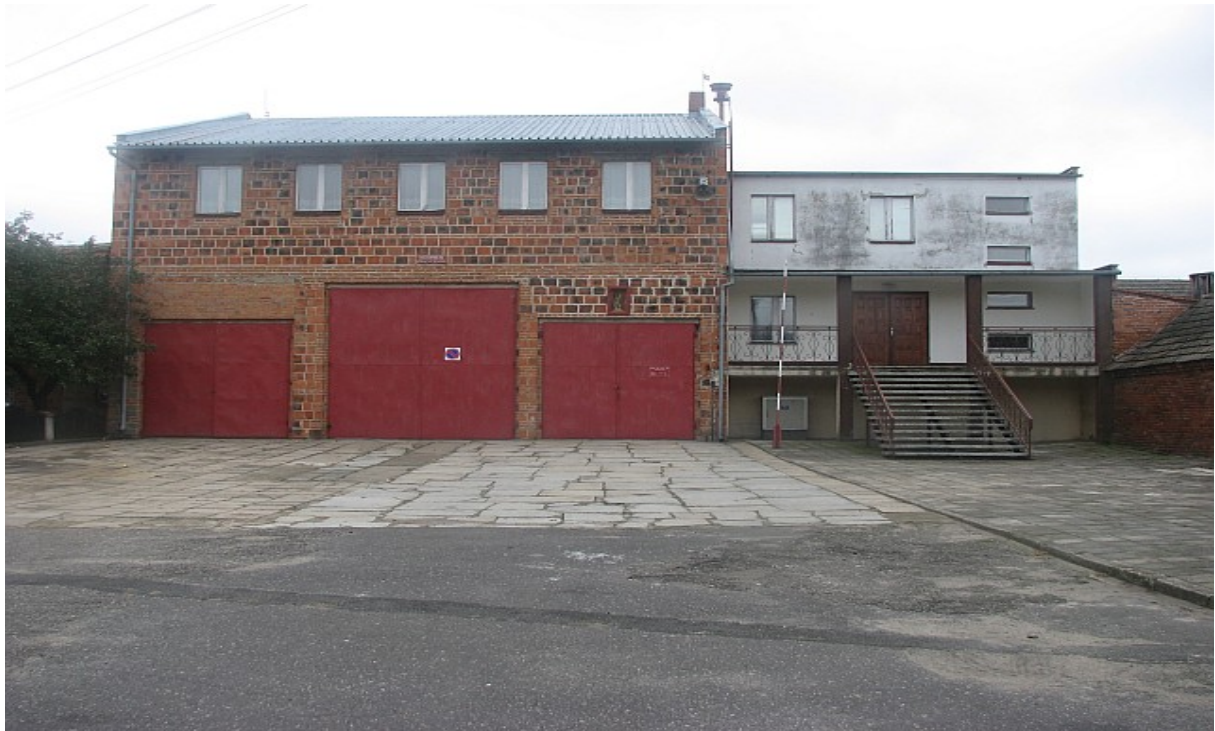
Zdjęcie powyżej przedstawia wejście do świetlicy wiejskiej w Gościejewicach przed planowanym remontem

Projekt 1: Przebudowa budynku świetlicy wiejskiej wraz z remontem i wymianą dachu, okien, podłóg w świetlicy wiejskiej.