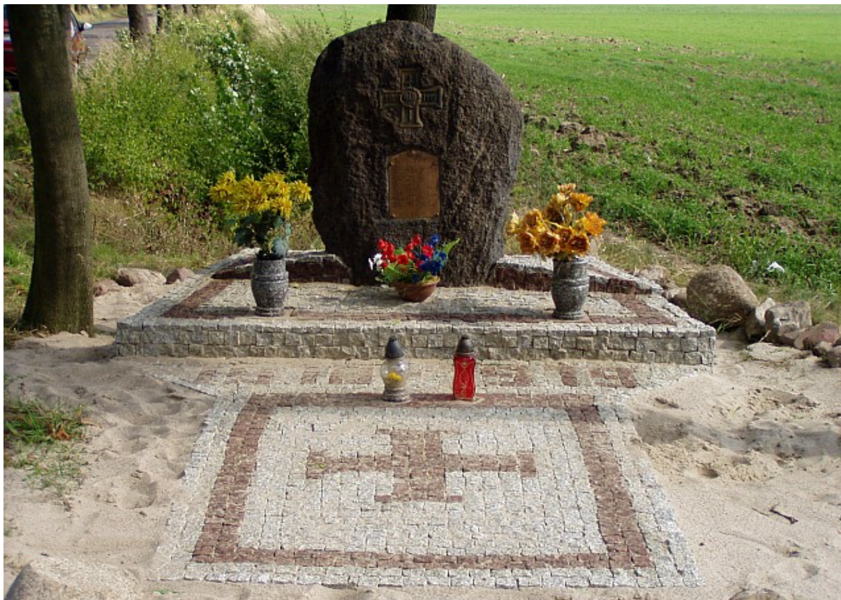
Głaz narzutowy poświęcony poległym powstańcom odcinka ponieckiego podczas bitwy o Gościejewice

W czterdziestą rocznicę wybuchu powstania wielkopolskiego na skrzyżowaniu dróg Bojanowo – Poniec – Gościejewice odsłonięty został okazały głaz narzutowy poświęcony poległym tu w dniu 19 stycznia 1919 roku powstańcom odcinka ponieckiego. W 2009 roku z inicjatywy władz gminy Bojanowo został on gruntownie odnowiony.