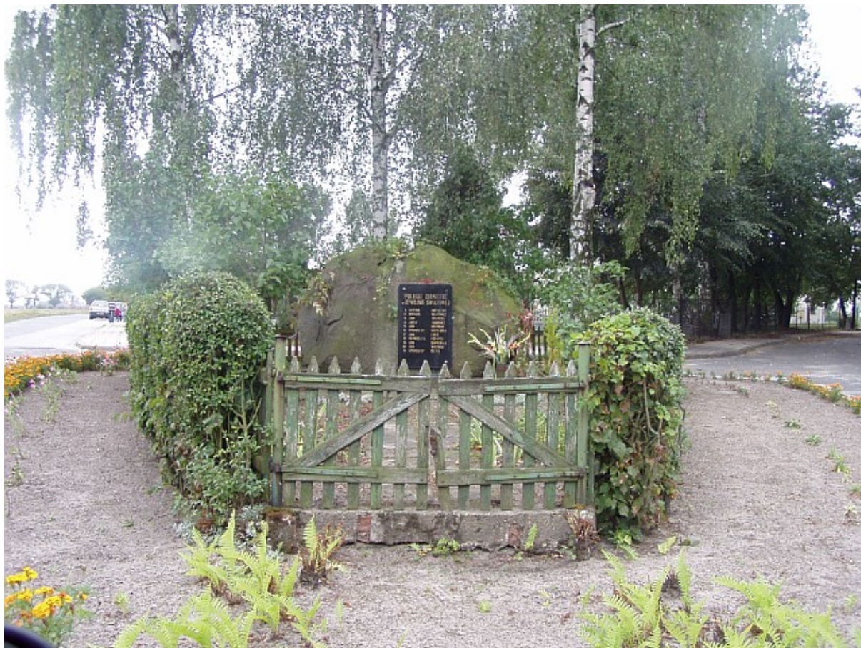
Pomnik poświęcony żołnierzom poległym podczas II wojny światowej

Zdjęcie poniżej przedstawia pomnik w Gościejewicach poświęcony żołnierzom z tego terenu poległym podczas II wojny światowej.