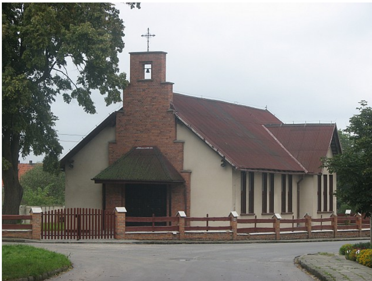
Kaplica p.w. Matki Boskiej Różańcowej w Gościejewicach

Zabudowa w północnej części wsi w złym stanie technicznym. W centralnym miejscu wsi niski współczesny kościółek nie dopasowany do zabudowy dominującej we wsi.