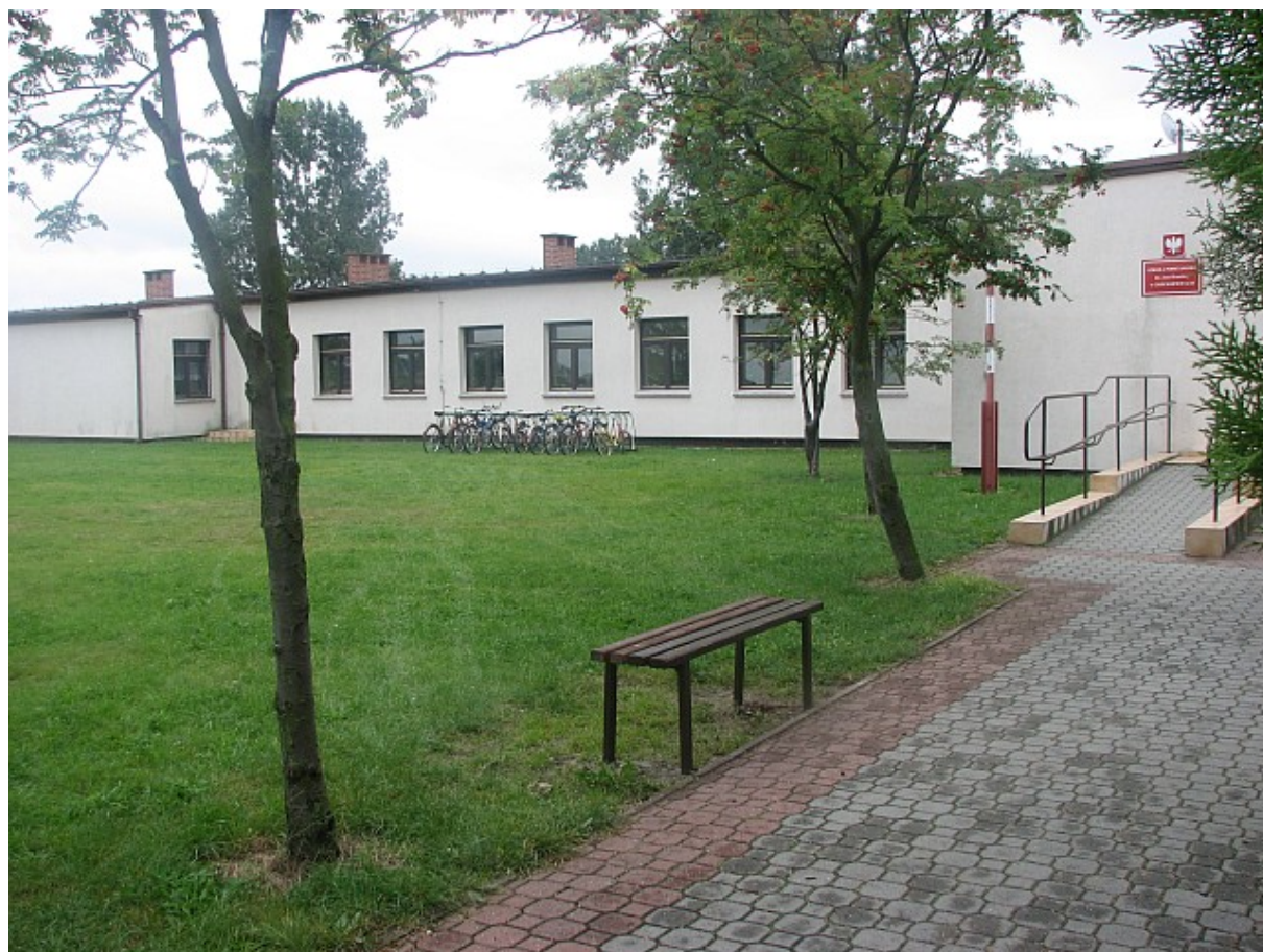
Budynek Szkoły Podstawowej im. Jana Brzechwy w Gościejewicach

W dniu 24 listopada 2004r. nastąpił ważny moment w dziejach szkoły. Tego dnia otrzymała imię Jana Brzechwy oraz sztandar. Aktualnie w Szkole Podstawowej w Gościejewicach pracuje 8 nauczycieli, 1 pedagog szkolny i 4 pracowników administracji i obsługi.