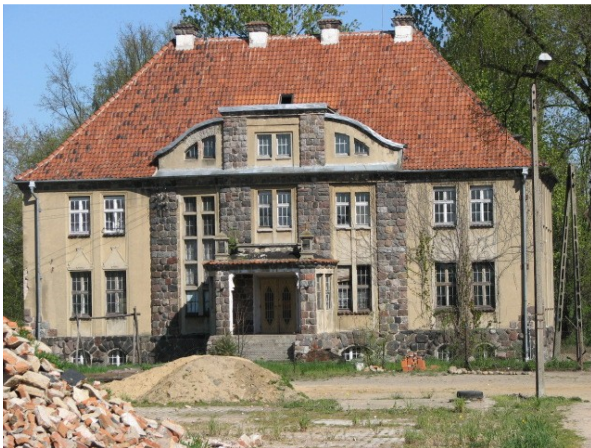
Pałac w Giżynie z 1922 roku

ekspresjonistyczne. Autorami projektu byli dwaj architekci z Wrocławia, Klein i Wolf. Prawdopodobnie posłużyli się typowym projektem przystosowanym na potrzeby fundatora. Budowla jest murowana, piętrowa na rzucie prostokąta. Zwieńczona wysokim czterospadowym dachem. Dłuższe siedmioosiowe elewacje - frontową i tylną urozmaicają środkowe trzyosiowe pseudoryzaliby zwieńczone szczytami nawiązującymi do form neobarokowych. Okna parteru wyróżniają linearne nad- i podokienniki o uproszczonych formach barokowych. Elewację frontową podkreśla niski portyk o kamiennych filarach głównego wejścia. W przedsionku po bokach umieszczono na dwóch kamieniach herb właścicieli i datę "1922". Główne wejście prowadzi przez niewielki westybuc do holu przed kominek z ozdobną metalową płytą. Klatka schodowa wyróżnia się pseudobarokową balustradą i częściowo zachowanym witrażem. Zespół zabudowań gospodarczych i budynek czworaków stanowi niejednorodną całość z końca XIX wieku zmodernizowaną w 1920 roku. W roku 1937 posiadłość Engelhardów liczyła 200 ha w tym 155,5 ha pól uprawnych, łąk i lasów. Ponadto w obrębie posiadłości znajdował się 2 hektarowy park oraz ogród o tej samej powierzchni. 4,5 hektara zajmowała uprawa szparagów. W majątku funkcjonowała cukrownia i młyn.