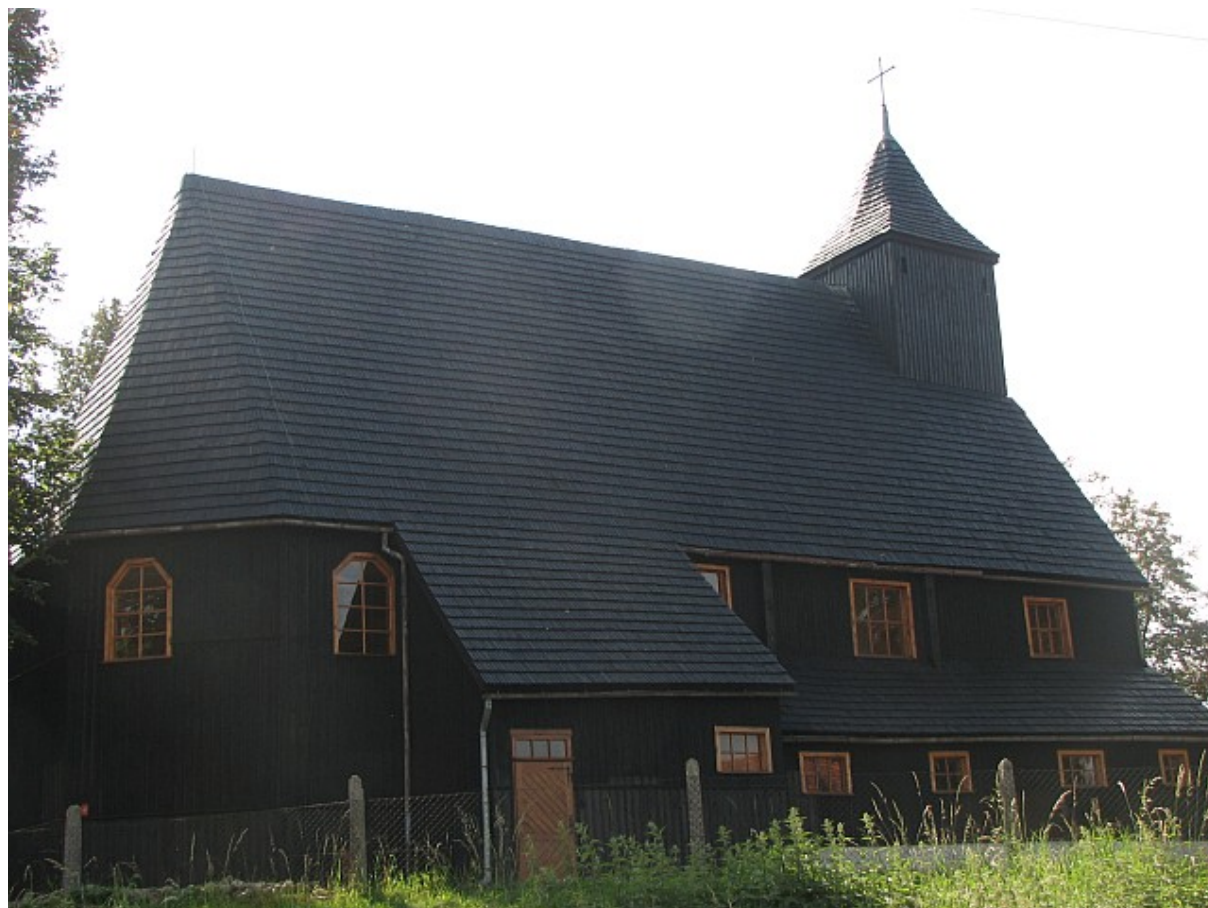
Kościół filialny p.w. Narodzenia NMP w Giżynie

Wybudowany w 1652 roku na miejscu kościoła katolickiego. Charakteryzuje się tradycyjnym jednoprzestrzennym układem. Budowla jest konstrukcji drewnianej zrębowej i szachulcowej z podwaliną na niskiej podmurówce.