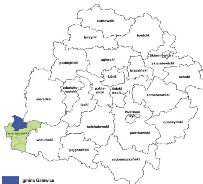
Mapa 1. Lokalizacja gminy Galewice w województwie łódzkim