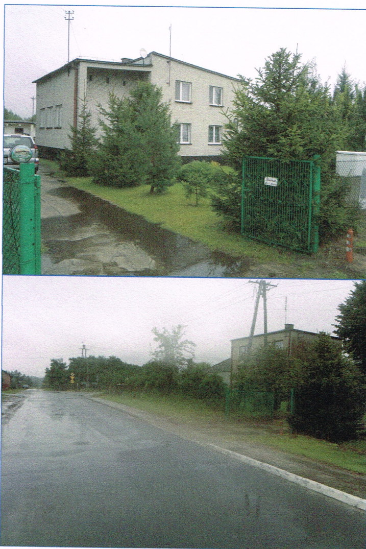
Fot. nr 5, 6. Najbliższe otoczenie i sąsiedztwo budynku mieszkalno – usługowego nr 20