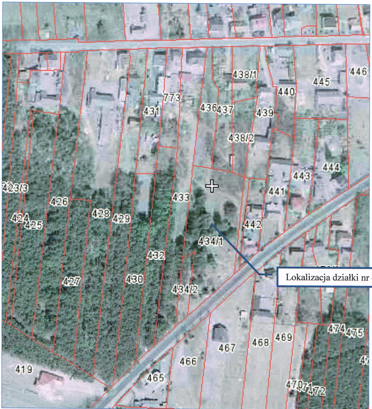
Fot. 9. Fragment mapy satelitarnej z działką nr 434/1