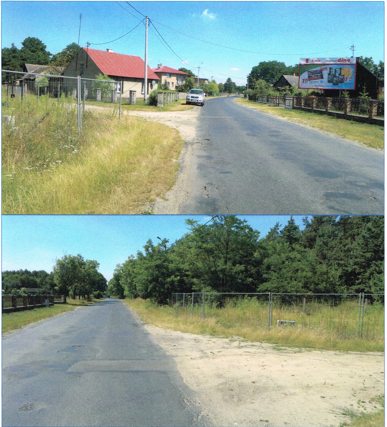
Fot. nr 3, 4. Widok na najbliższe sąsiedztwo i otoczenie wycenianej działki nr 434/1