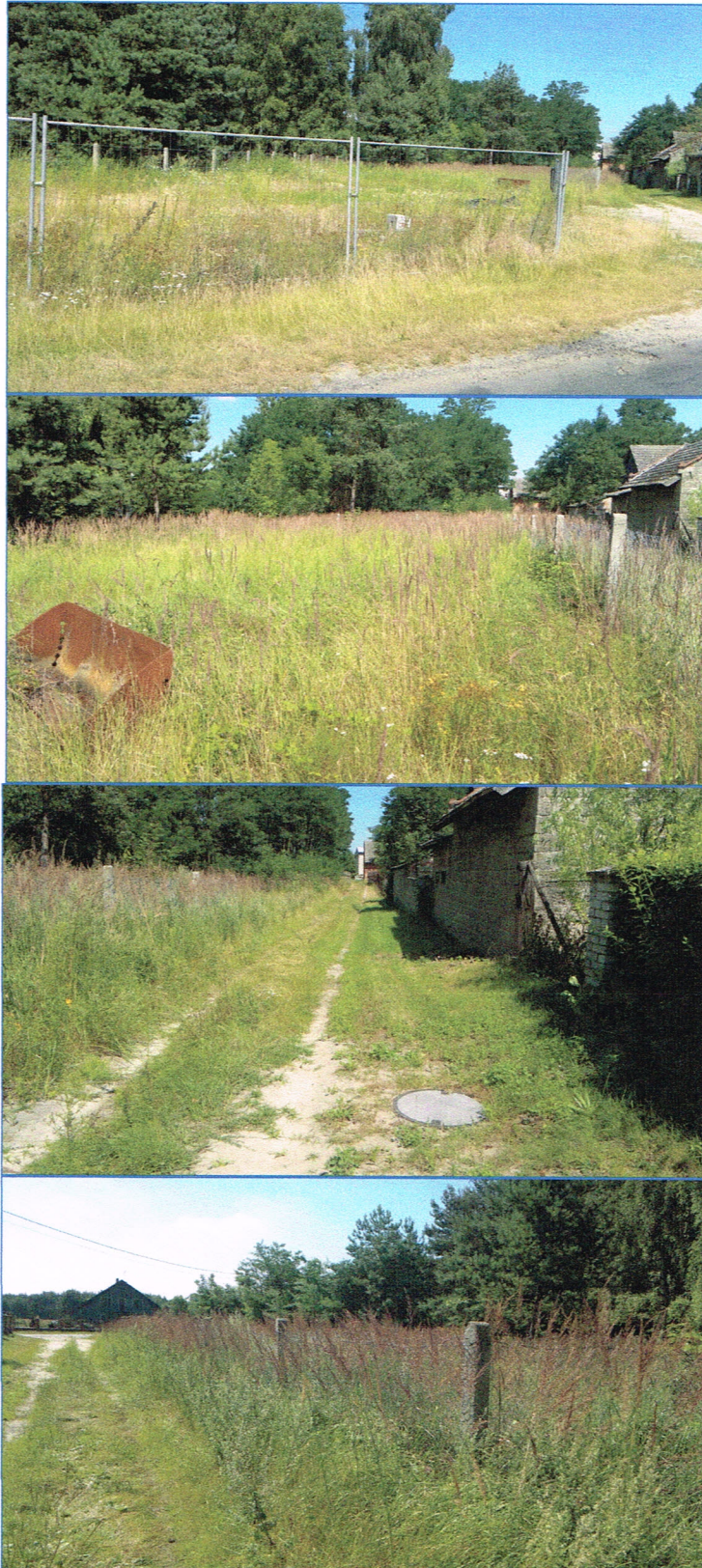
Fot. nr 5 - 8. Widok na wycenianą działkę nr 434/1 z różnych stron