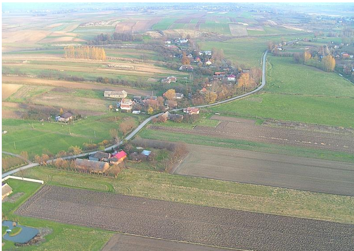
Rys. 3 Zabudowa miejscowości Wolica

Centrum wsi tworzy zabudowa wzdłuż ww. drogi gminnej. Znajdują się tu: Dom Ludowy, Ochotnicza Straż Pożarna.