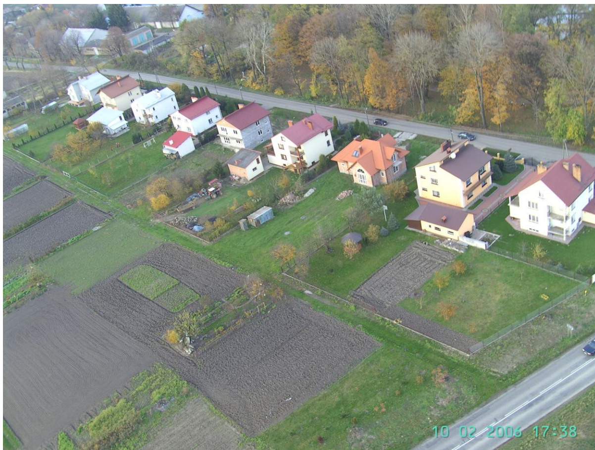
Rys. 3 Zabudowa miejscowości Mikulice