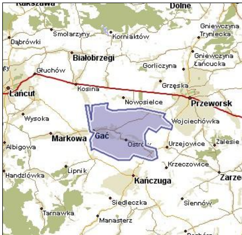
Rys. 1 Mapa Gminy Gać

Mikulice mają rolniczy charakter. Położenie miejscowości, urodzajne ziemie i brak lasów zdecydowały o charakterze miejscowości.