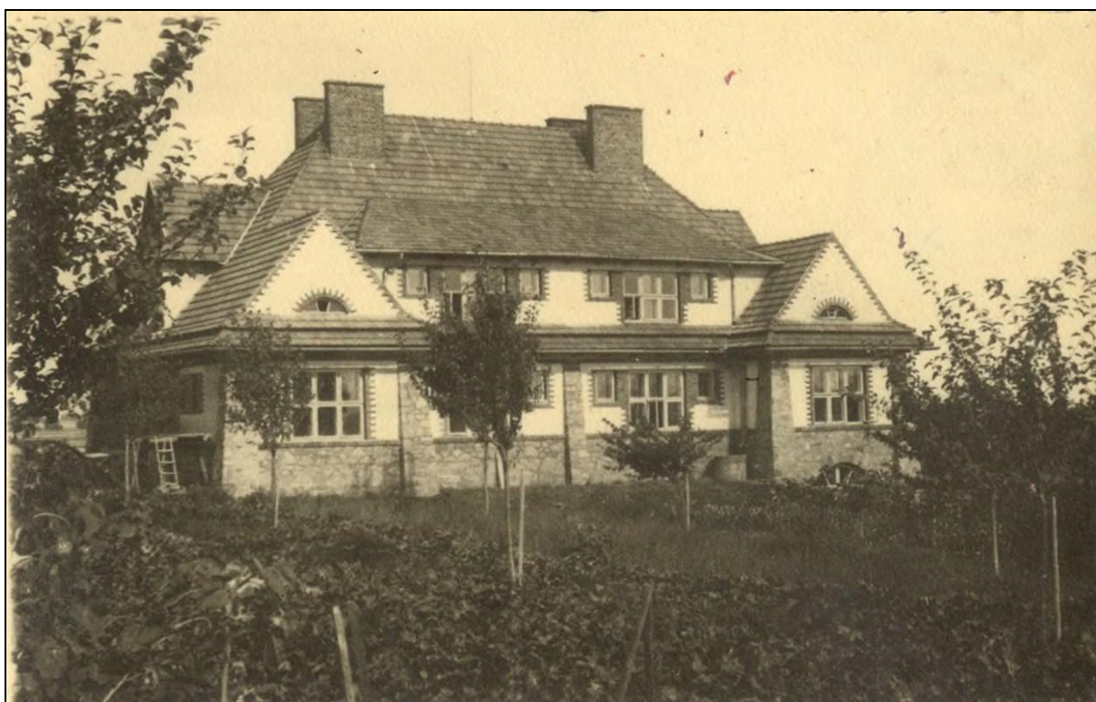
Rys. 3 Budynek Orkanowego Uniwersytetu Ludowego w Gaci