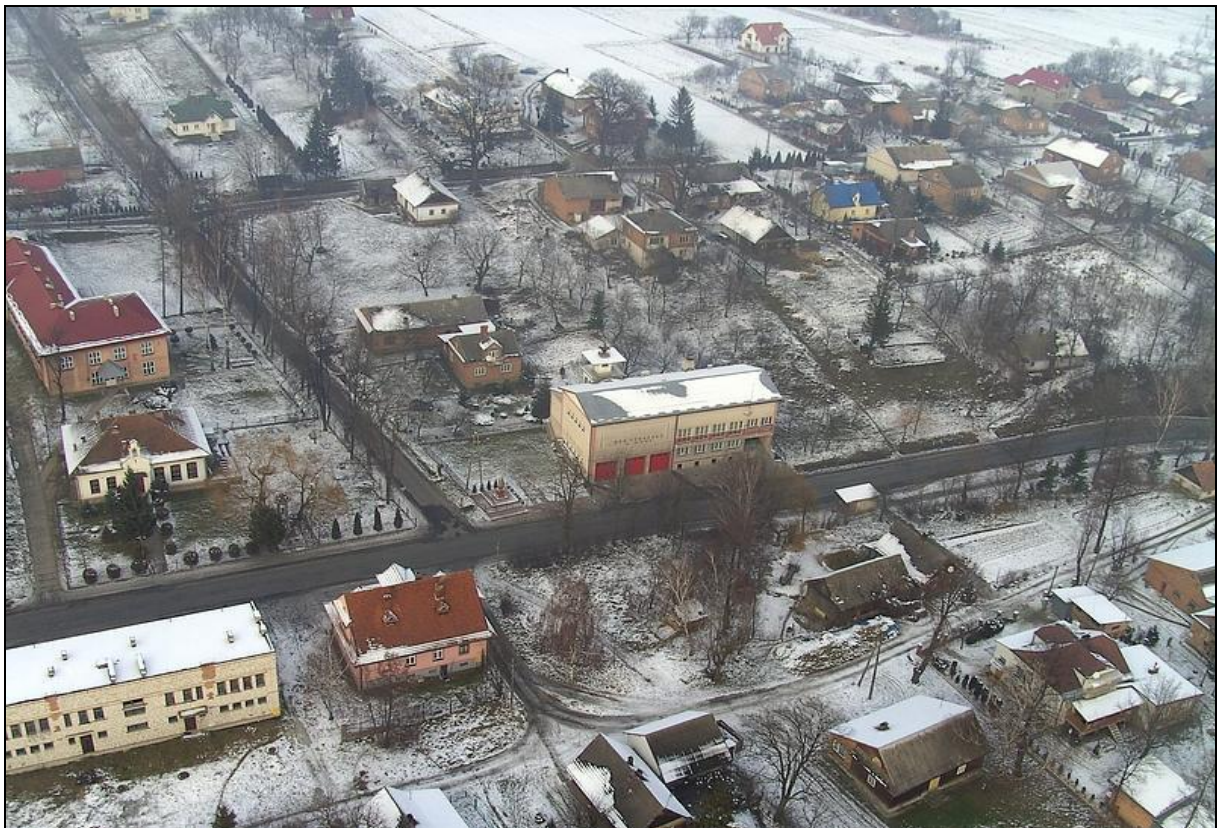
Rys. 4 Zabudowa miejscowości Gać

Centrum wsi tworzy zabudowa wzdłuż ww. drogi powiatowej. Znajdują się tu: Gminna Spółdzielnia Samopomoc Chłopska, Spółdzielnia Kółek Rolniczych, Zlewnia Mleka, Stadion Sportowy, Bank Spółdzielczy, Gminny Ośrodek Kultury, Gminna Biblioteka Publiczna, Urząd Gminy, Ochotnicza Straż Pożarna, Zespół Szkół Podstawowych, Przedszkole, Poczta, Kościół.