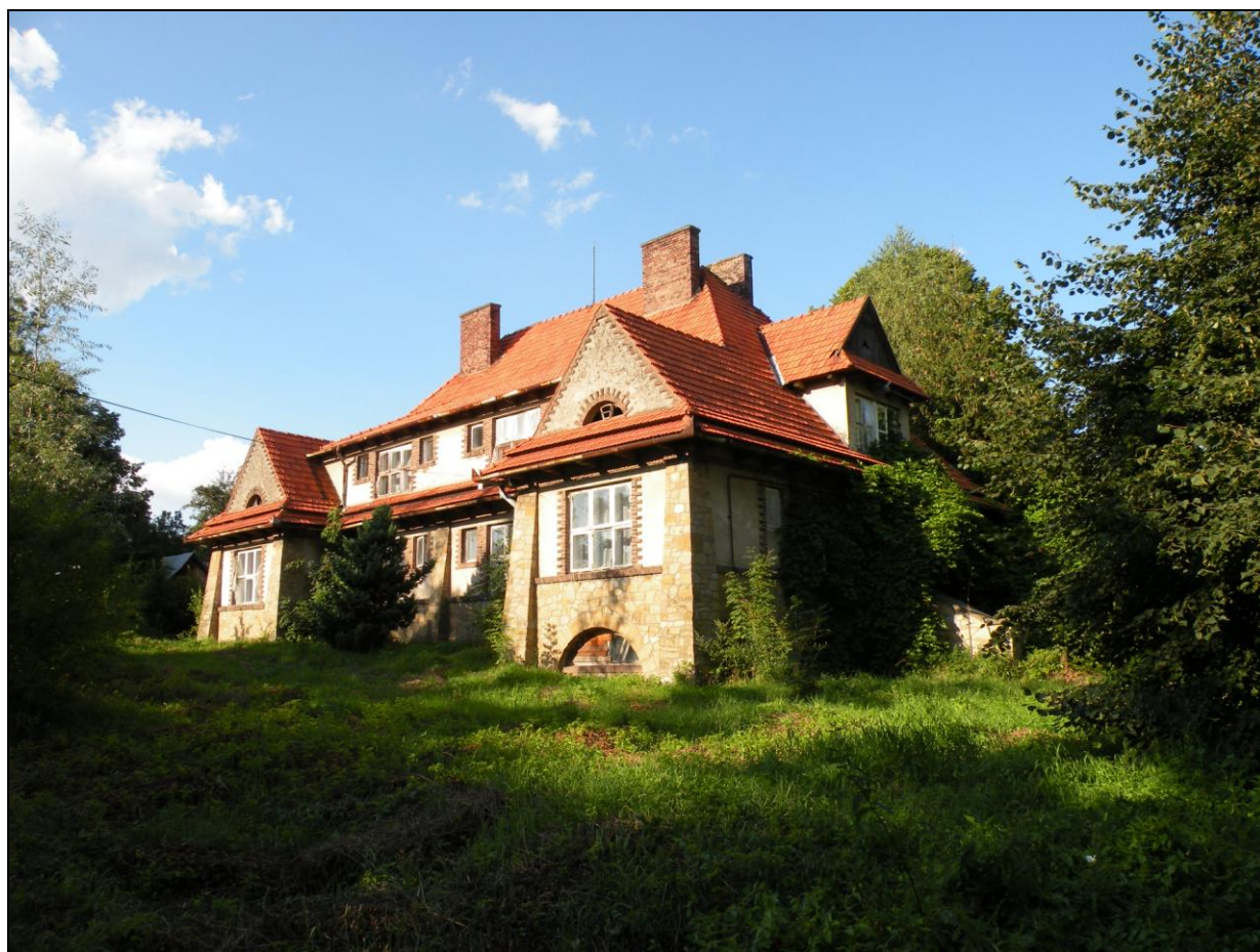
Rys. 5 Uniwersytet Ludowy w Gaci