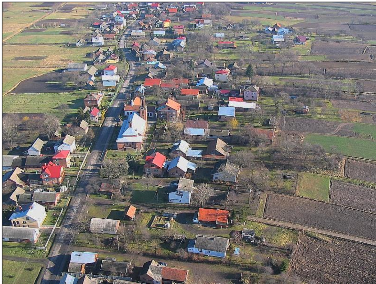
Rys. 3 Zabudowa miejscowości Dębów