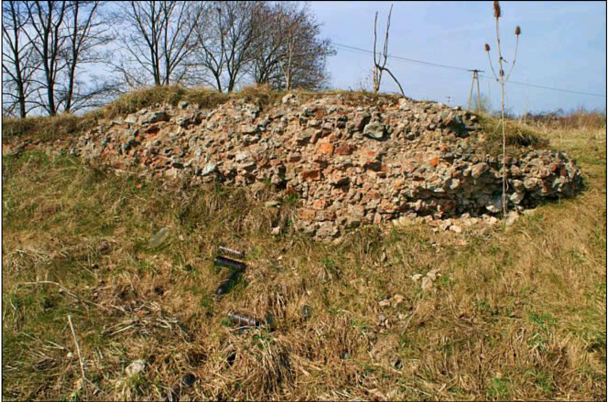
Rys. 3 Pozostałości zespołu zamkowego