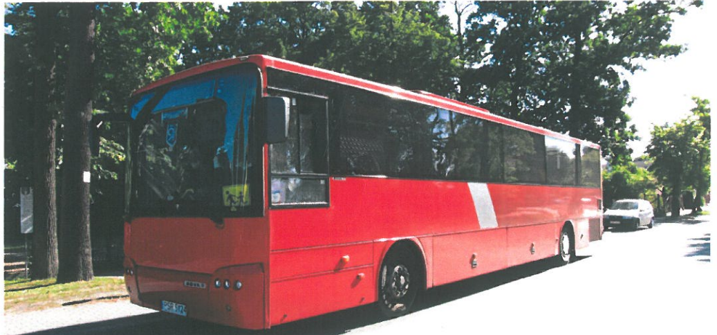
inż. Edw Fot. 4 RZECZOZNAWCA ds. wyceny maszyn i urządzeń BIEGŁY SKARBOWY Nr 94 z listy Izby Skarbowej w Poznaniu