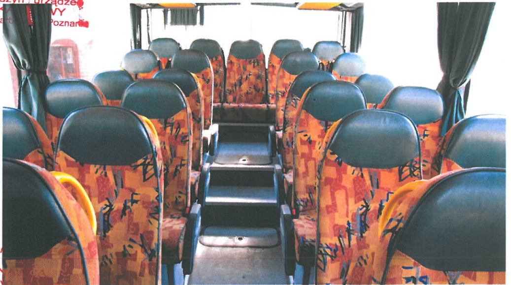
inż. Edw Fot. 5 RZECZOZNAWCA ds. wyceny maszyn i urządzeń BIEGŁY SKARBOWY Nr 94 z listy Izby Skarbowej w Poznaniu