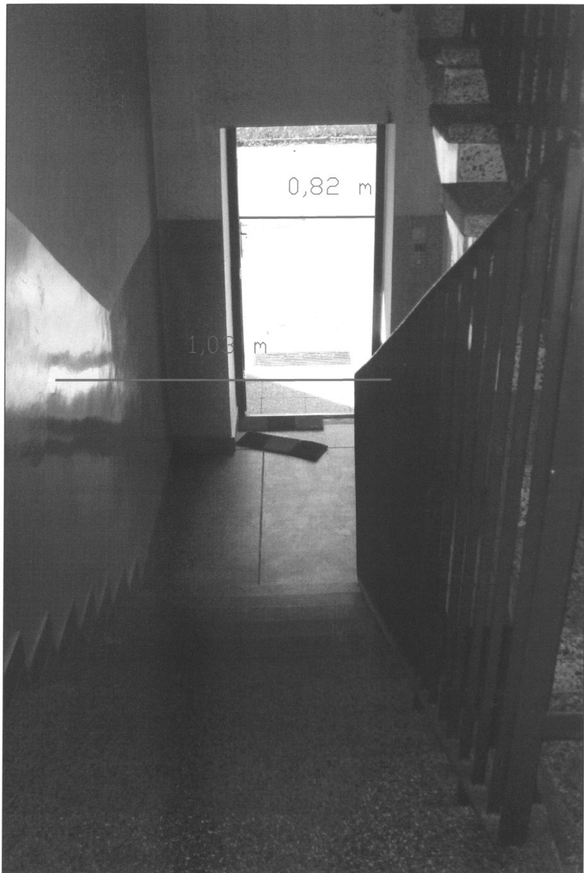
Fot.1 Klatka schodowa K1 i drzwi wyjściowe