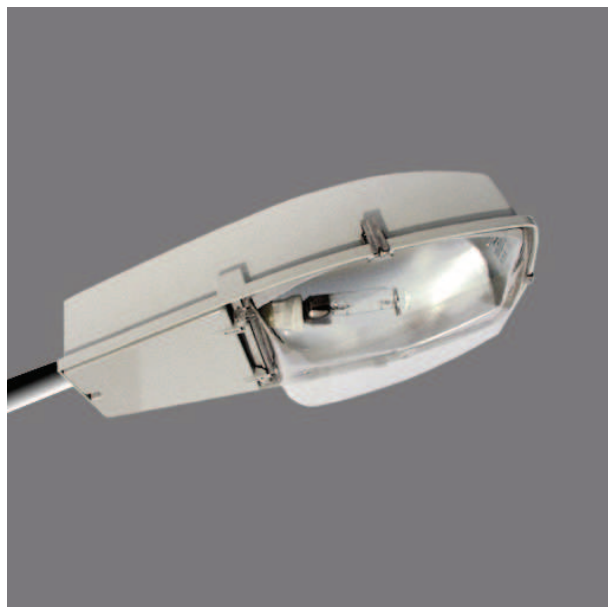
Wylot światła 1: