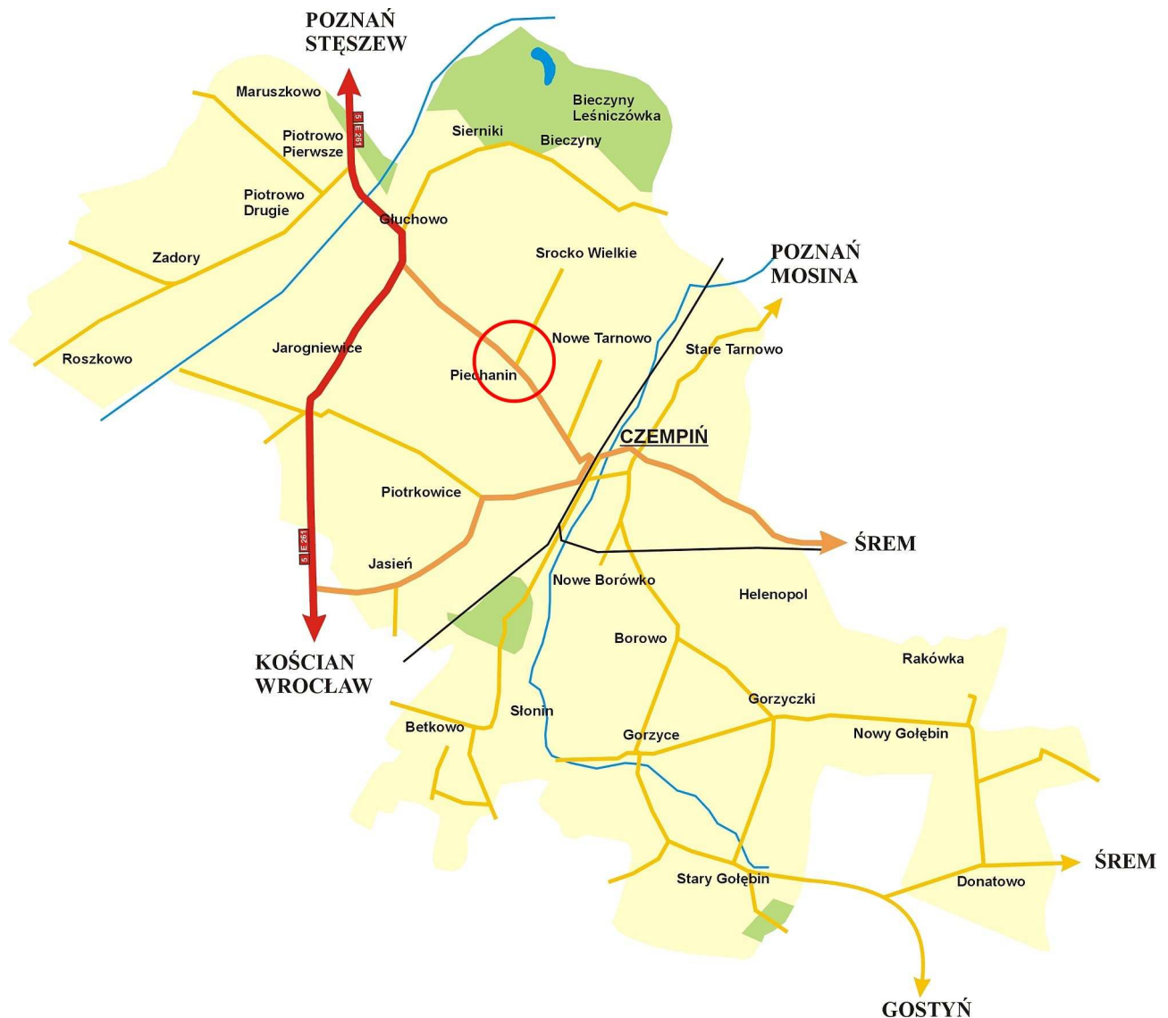
Plan gminy Czempień (rys.1)

Gmina stanowi 19,72% powiatu. Sołectwo Piechanin zajmuje obszar 575 ha i stanowi 4,04 % powierzchni gminy.