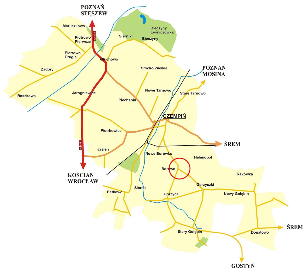
Plan gminy Czempień (rys.1)

Gmina stanowi 19,72% powiatu. Sołectwo Borowo z przysiółkiem Helenopol, zajmuje 1172 ha i stanowi 8,24 % powierzchni gminy.