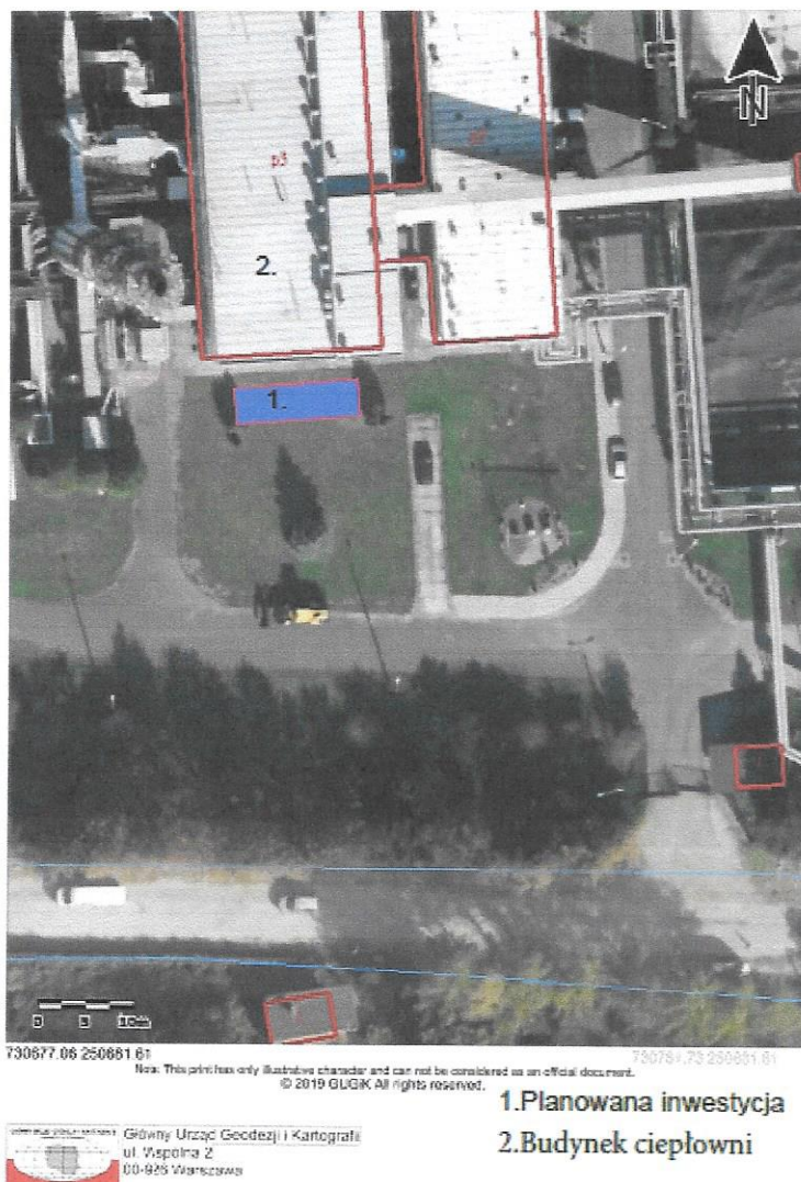
Rysunek 1. Proponowana lokalizacja Instalacji kogeneracyjnej z silnikiem gazowym

Nowe źródło ciepła i energii elektrycznej należy włączyć do systemu ciepłowniczego Ciepłowni Łańcut i pracy na wspólną sieć z istniejącymi kotłami węglowymi OR5-N, OR10, WR8-EM, OR10-EM.