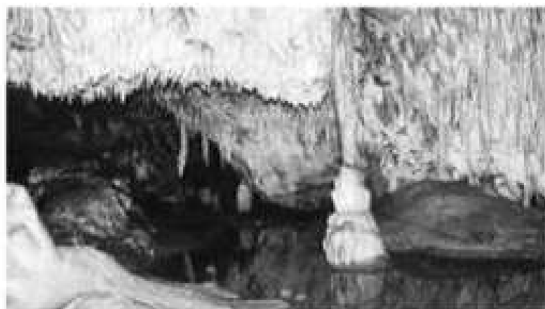
(fot. Jaskinia „Raj”)

szczątki kości zwierząt plejstocenijskich wydobyte z jaskini podczas badań archeologicznych oraz stanowiska człowieka neandertalskiego, mieszkającego tu przed ponad pięćdziesięcioma tysiącami lat. Od 1968 roku jaskinia, wraz ze wzgórzem „Malik” i fragmentem lasu, stanowi prawnie chroniony rezerwat przyrody. Wspaniała i bogata szata naciekowa jaskini została wyeksponowana poprzez elektryczne oświetlenia jej wnętrza.