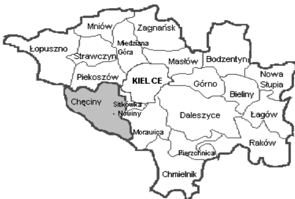
Rys. nr 1. Mapa powiatu kieleckiego.

Obszar gminy włączony jest w obręb powiatu Kielce, w województwie świętokrzyskim.