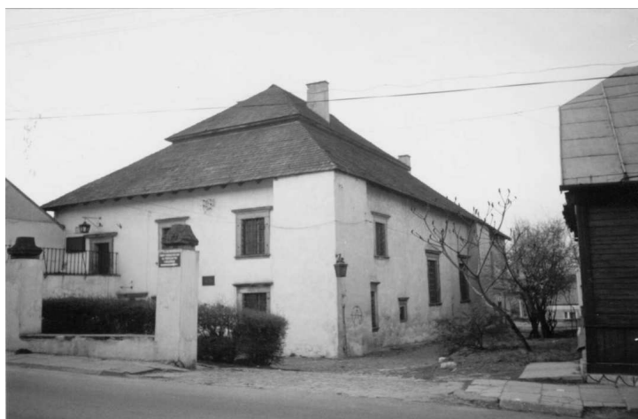
Fot. 5. Synagoga

Dawna bóżnica, czyli świątynia żydowska została wzniesiona w Chęcinach po roku 1638 i zaliczana jest do wybitnych polskich obiektów późnorenesansowych. Nieznany jest budowniczy, choć wiadomo, że w czasie, gdy powstawała, działał w mieście budowniczy żydowski Hersz, syn Szyfry. Obiekt zachował się w prawie, niezmiennym stanie.