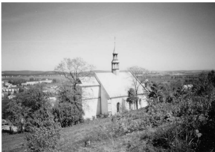
Fot. 2 Kościół Parafialny p w Św. Bartłomieja

Obniżono wówczas dachy i wzniesiono od strony zachodniej wieżę. Przy północnym wejściu do kościoła umieszczono pięć kamiennych tablic z nazwiskami ofiar II wojny światowej.