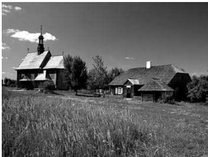
Fot. 8. Park Etnograficzny w Tokarni

W skansenie tym od kilku lat w czerwcu odbywa się impreza folklorystyczna z pokazem wytopu ołowiu w prymitywnych piecach.