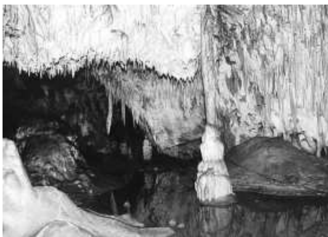
Fot.7. Jaskinia Raj

Zwiedzanie jaskini odbywa się w małych grupach (do 15 osób), tylko w towarzystwie przewodnika. 11