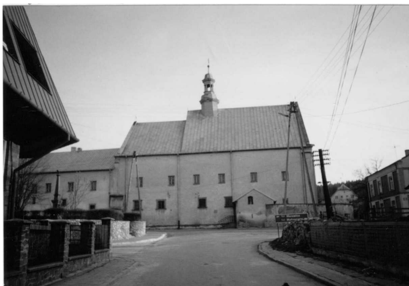
Fot. 4. Klasztor SS. Bernardynek

Do opustoszałego na skutek zakazów carskich klasztoru klarysek w 1924 roku sprowadzono bernardynki z Wilna. Gospodarują w nim do dzisiaj.