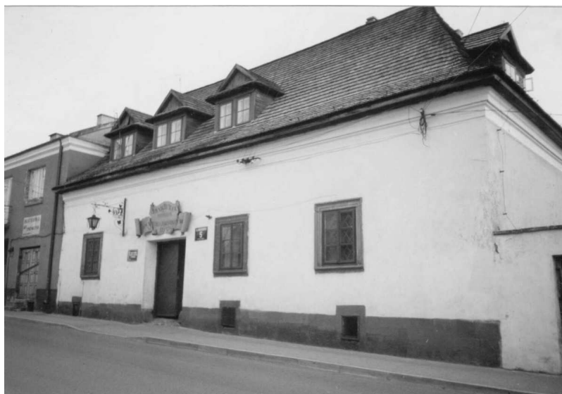
Fot.6. Niemczówka

Na parterze w dużej sali jest trzyczęściowe okno z renesansowymi kolumnkami oraz belka stropowa -sosrąb- z datą 1634 r. i nazwiskiem ówczesnego burmistrza chęcińskiego Walentego Soboniewskiego. W budynku są także zabytkowe piwnice sklepione kolebkowo. Pierwotnie budynek był parterowy, obecnie ma również półpiętro wbudowane w dach i przystosowane na mieszkania komunalne. 10