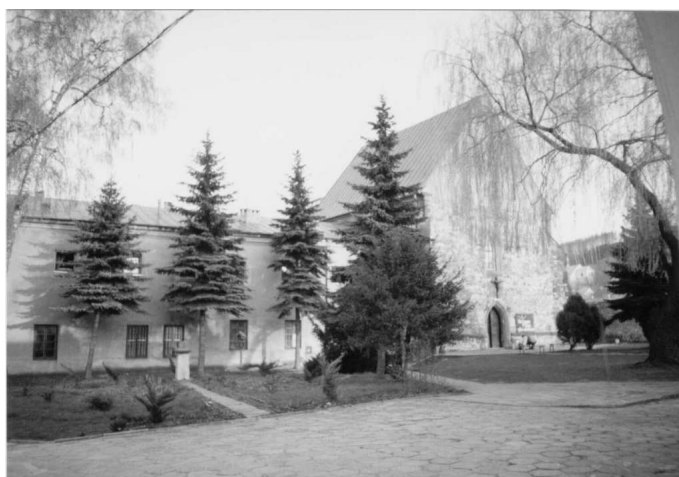
Fot.3. Klasztor OO. Franciszkanów