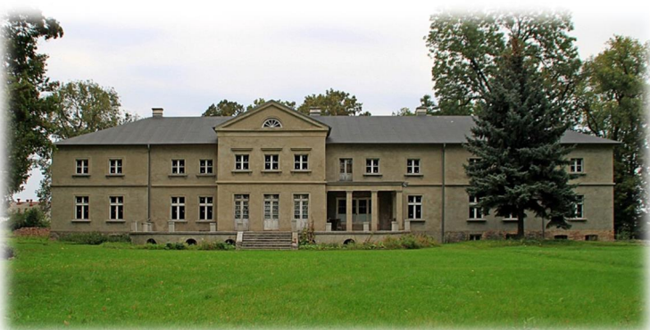
Rysunek 8: Dwór Zakrzewskich

W 2004 roku został sprywatyzowany pałac. W tym samym roku 1 maja (w dniu wejścia Polski do Unii Europejskiej) oddano do użytku remizę Ochotniczej Straży Pożarnej – zaadoptowaną z pomieszczeń dawnej kotłowni. Sala ta służy również m.in. do zebrań wiejskich i spotkań społeczności wsi.