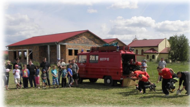
Rysunek 10: Pokazy strażackie, w tle budynek sali wiejskiej

Latem 2009 r. zaczęto budowę „sali wiejskiej – remizy OSP”.