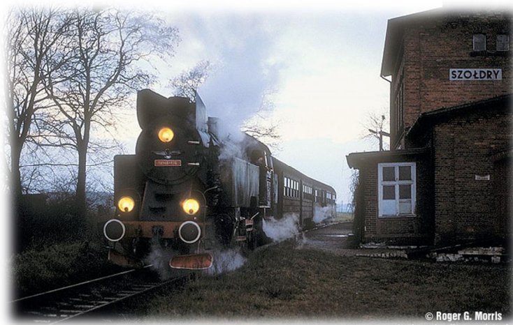
Rysunek 5: Dworzec kolejowy

Daniel Olbrychski w książce „Anioły wokół głowy” wspomina o filmie z 1967 roku „Skok” w reżyserii Kazimierza Kutza, do którego niektóre sceny kręcono w Szołdrach. Jest to sensacyjny dramat psychologiczny: historia dwóch siedemnastolatków, którzy po niezdanej maturze uciekają