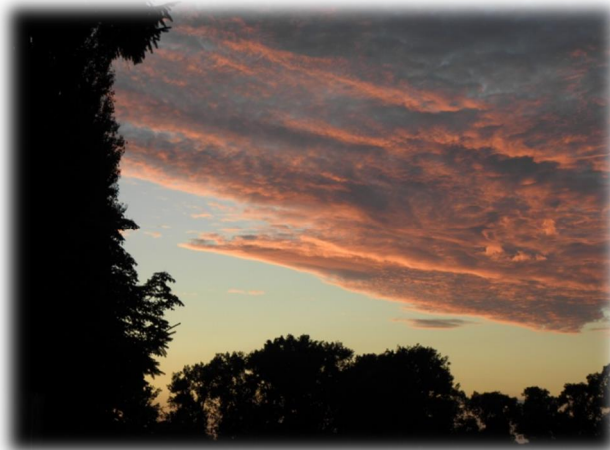
Rysunek 15: Zachód słońca

Brak przemysłu i miejsc pracy może powodować odpływ młodych ludzi w poszukiwaniu pracy i godnego poziomu życia.