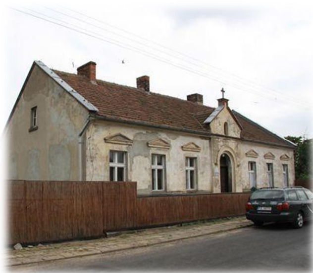
Rysunek 4: Budynek dawnej szkoły

Z informacji zawartych w dokumentach wizytacji Parafii w roku 1869 wynika, że w Szołdrach funkcjonowała szkoła elementarna. Uczył w niej według dokumentów „przykładowy nauczyciel”, a nadzór sprawował zarządca Parafii. Dla ciekawości należy podać, że w 1895 roku było 124 uczniów, w tym pięciu innego wyznania, w roku 1908 było 110 uczniów, a w roku 1938 było 82 uczniów, w tym dwóch innego wyznania. W chwili obecnej dobrze zachowany został układ przestrzenny dawnego