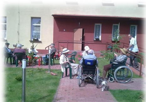
Rysunek 9: Całodobowy Dom Opieki "Seniorowo"

W roku 2006 sprzedano budynek dawnej „Tysiąclatki” i powstał tam Całodobowy Dom Opieki.