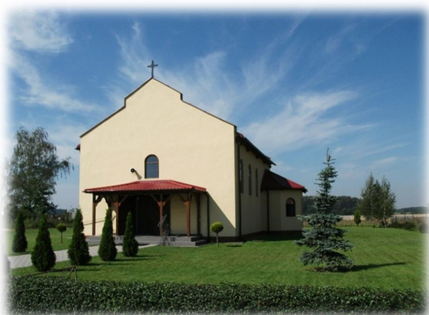
Rysunek 7: Kościółek w Szotłdrach

Pozytywnym składnikiem życia społeczności w Szotłdrach i Rogaczewie jest niezagubiona w zawirowaniach „dziewiczych” chęć działania dla wspólnego dobra.