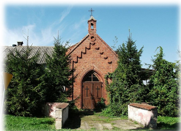
Rysunek 3: Kaplica - kostnica

Wokół dworu rozciąga się park krajobrazowy z końca XVIII wieku o powierzchni 4,21 hektara, a w nim m. in. trzy płatany klonolistne o obwodzie 480-560 cm, dwa jesiony wyniosłe o obwodzie 440 cm i 450 cm.