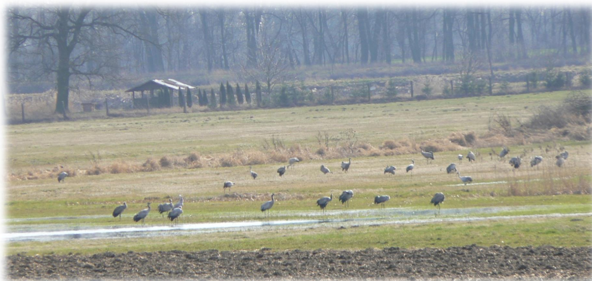
Rysunek 17: Ostoja na przelotach żórawi

Brak przemysłu i miejsc pracy może powodować odpływ młodych ludzi w poszukiwaniu pracy i godnego poziomu życia.