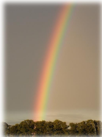
Rysunek 16: Tęcza