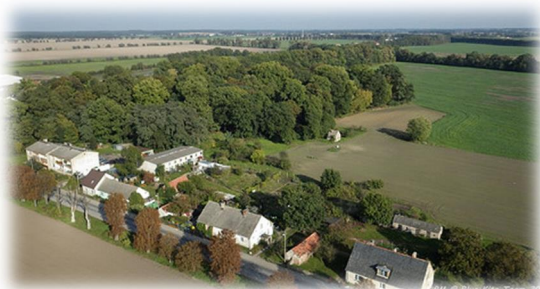
Rysunek 12: Szołdry

Według klasyfikacji bonitacyjnej, uwzględniając żyzność gleby, stosunki wodne, stopień kultury i trudność uprawy w powiązaniu z agroklimatem, rzeźbą terenu oraz niektórymi elementami stosunków gospodarczych, na obszarze miejscowości w grupie gruntów ornych zdecydowanie przeważają grunty orne IIIb, IIIa IVa i II.