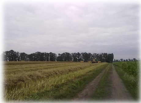
Rysunek 13: Żniwa w Rogaczewie

Według danych Urzędu Gminy w Brodnicy Śremskiej w Szotdrach jest jedno gospodarstwo rolne (wg odprowadzanego podatku rolnego). Prócz tego rolniczą działalność prowadzi Kombinat Rolno-Przemysłowy – Ferma Szotdry.