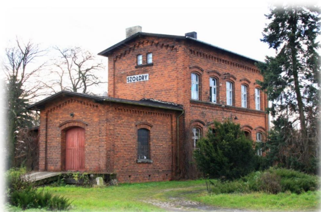
Rysunek 6: Dworzec kolejowy