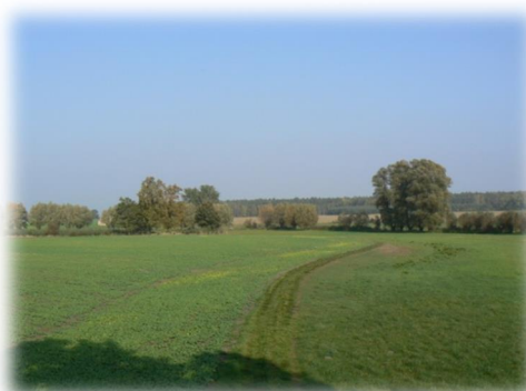
Rysunek 14: Łąka

To, co jest szansą, może stanowić zagrożenie.