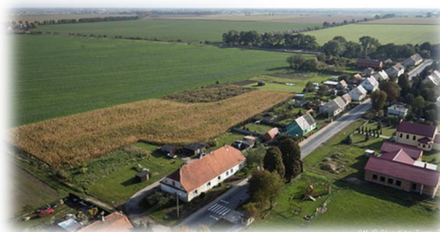
Rysunek 11: Szołdry

Powierzchnia obrębu miejscowości Szołdry wynosi 823,42 ha (ornych 585,96 ha, sady 1,38 ha, łąki 24,68 ha, pastwiska 13,34 ha, użytki, grunt leśny 138,45 ha, zakrzewienie, zalesienie 2,26 ha, wody stojące 15,79 ha, rowy 3,26 ha, tereny – drogi 21,39 ha, koleje, inne 2,83 ha, zabudowa 11,01 ha, zieleńce 2,79 ha, nieużytki 0,39 ha).